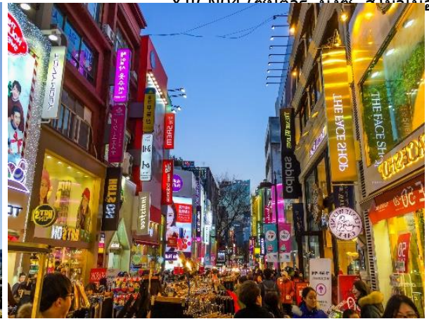
XJ709 (สำหรับเที่ยววันเสาร์)

คำ อิสระอาหารค่ำตามอัธยาศัย เพื่อสะดวกแก่การเดินทางท่องเที่ยว ที่พัก โรงแรม GALAXY HOTEL หรือเทียบเท่า 3 ดาว